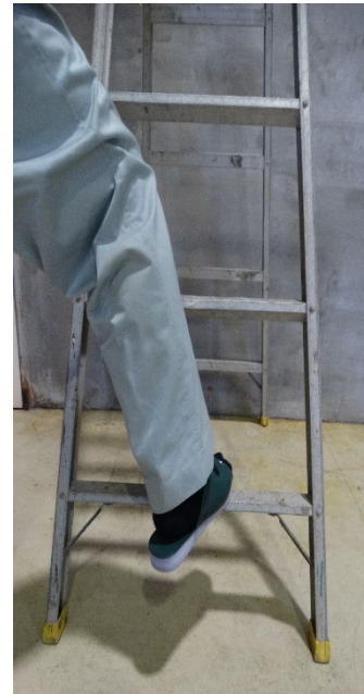
×サンダル履きで登る