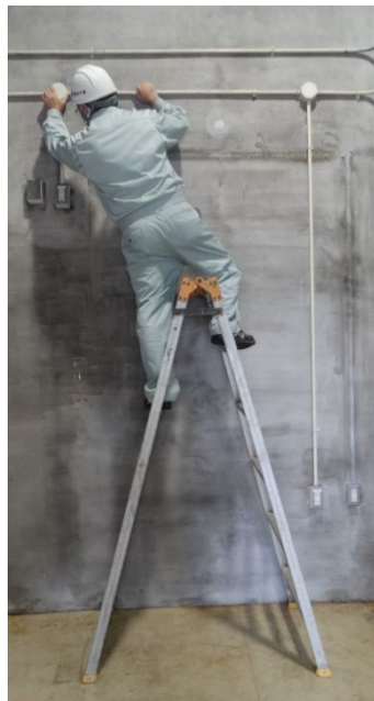
×脚立から降り出す